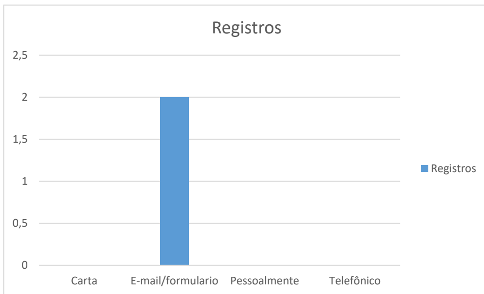
Figura 1 – Formas de contato

Neste período não houve manifestação referente a outros órgãos.