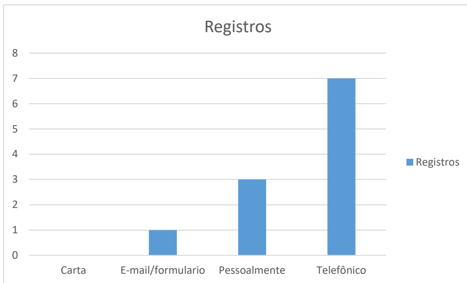
Figura 1 – Formas de contato

Neste período todas manifestações se referiam a Câmara Municipal de Limeira