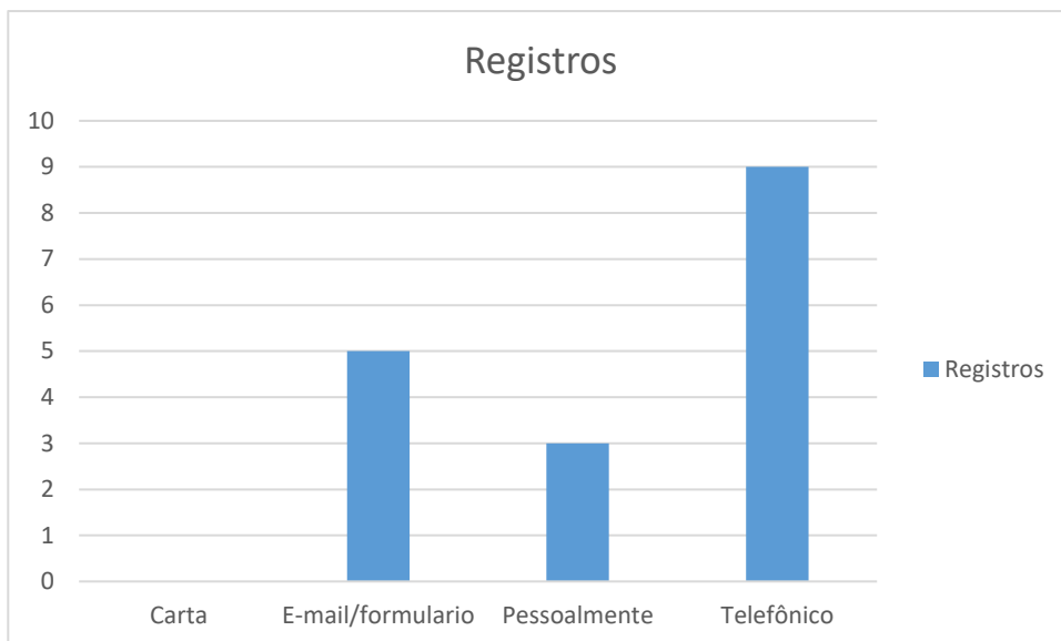
Figura 1 – Formas de contato

Neste período 2 manifestações se referiam a outros órgãos.