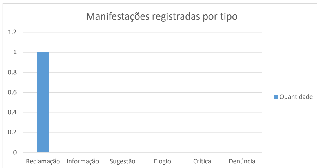
Figura 3 –Característica da demanda

A classificação da manifestação é feita pela munícipe no registro da sua manifestação.