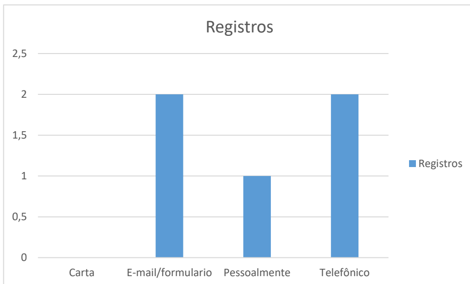
Figura 1 – Formas de contato

Neste período não houve manifestação referente a outros órgãos.