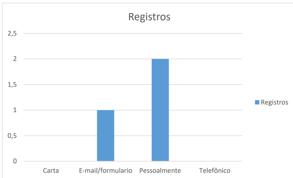
Figura 1 – Formas de contato

Neste período houve 1 manifestação referente a outros órgãos.