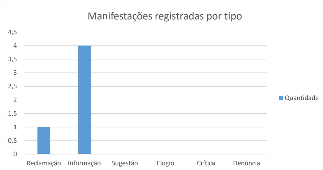
Figura 3 –Característica da demanda

A classificação da manifestação é feita pela munícipe no registro da sua manifestação.