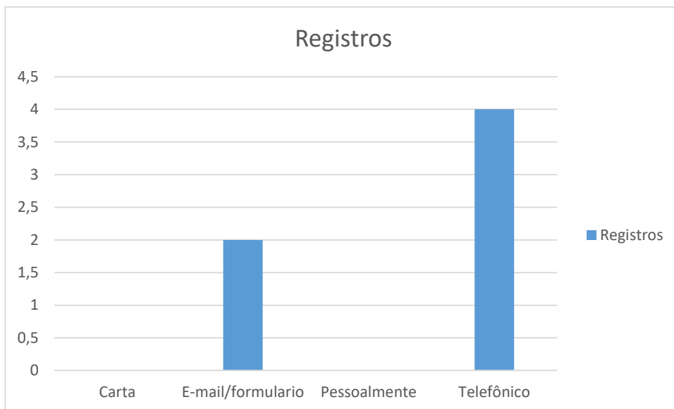
Figura 1 –Formas de contato

Neste período houve uma manifestação referente a outros órgãos.